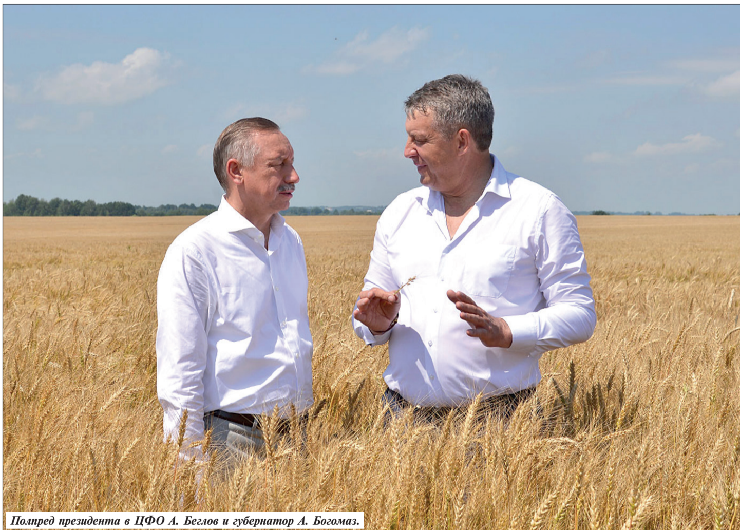
Полпред президента в ЦФО А. Беглов и губернатор А. Богомаз.

День поля, прошедший на базе Брянского агроуниверситета, продемонстрировал успехи в сфере АПК